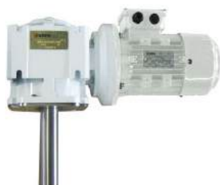
NHS мотор редуктор

Мешалка NHS представляет собой вертикальную мешалку с приводом от червячного мотор-редуктора. Она может использоваться для процессов перемешивания, растворения и поддержания однородности, там где требуется средняя интенсивность перемешивания.